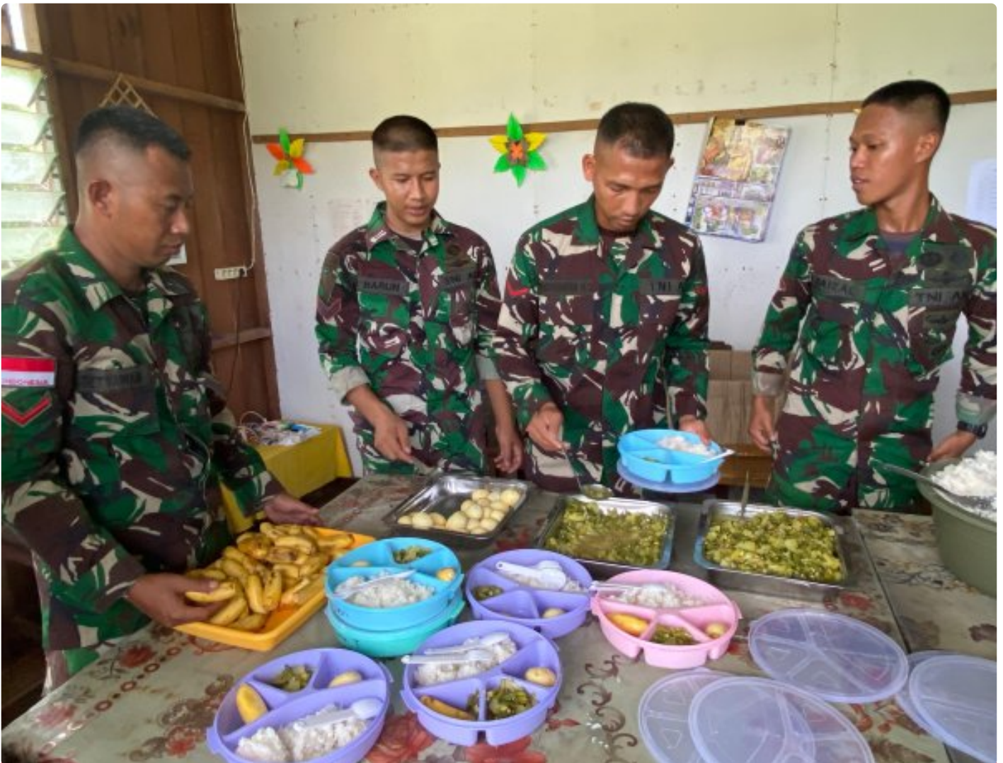
Foto: Dedikasi Satgas Pamantas Mobile RI-PNG Yonif 503/Mayangkara dalam mendukung program makan bergizi gratis pemerintah mendapat apresiasi tinggi dari masyarakat Distrik Krepkuri, Kabupaten Nduga, Papua, di sekolah rimba, Rabu (29/01/2025).

NDUGA- Dedikasi Satgas Pamantas Mobile RI-PNG Yonif 503/Mayangkara dalam