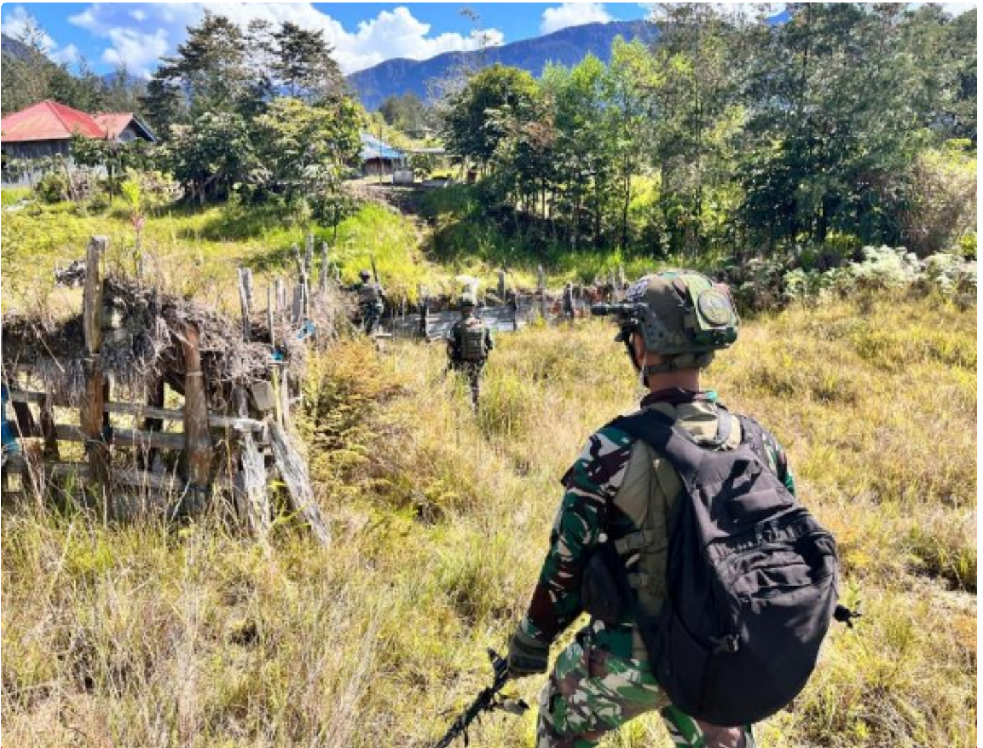
Satgas Mobile Yonif 323 Buaya Putih melaksanakan Patroli Komsos

Satgas Yonif 323 Buaya Putih Kostrad pada saat melaksanakan patroli menjaga keamanan di sektor wilayah tanggungjawabnya di wilayah kampung Gigobak, Distrik Sinak, Kabupaten Puncak, Papua terjadi kontak tembak dan pengejaran terhadap kelompok OPM, Rabu (04/12/24)